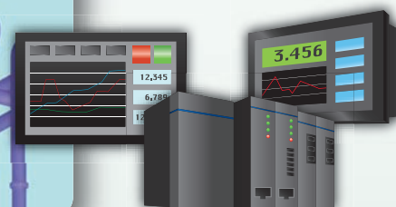
コントロール機構 操作性の高いカラータッチパネル採用