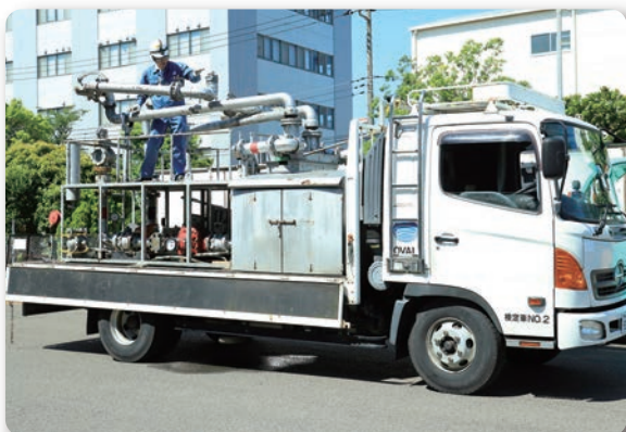
流量標準器を搭載した移動検定車

●横浜、岡山の拠点には国内最高レベルの校正設備を保有しており、高精度、高品質な校正サービスをご提供いたします。また、弊社所有の流量標準器及び移動検定車を使用した、現地での流量計校正も可能です。