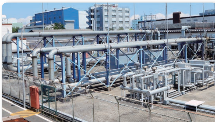
基準体積管 (横浜、岡山)