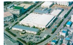
株式会社オーバル 横浜事業所