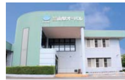
株式会社山梨オーバル