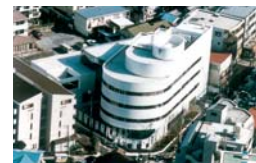
株式会社オーバル 本社