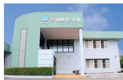
株式会社山梨オーバル