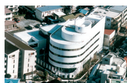
株式会社オーバル 本社