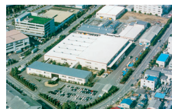
株式会社オーバル 横浜事業所